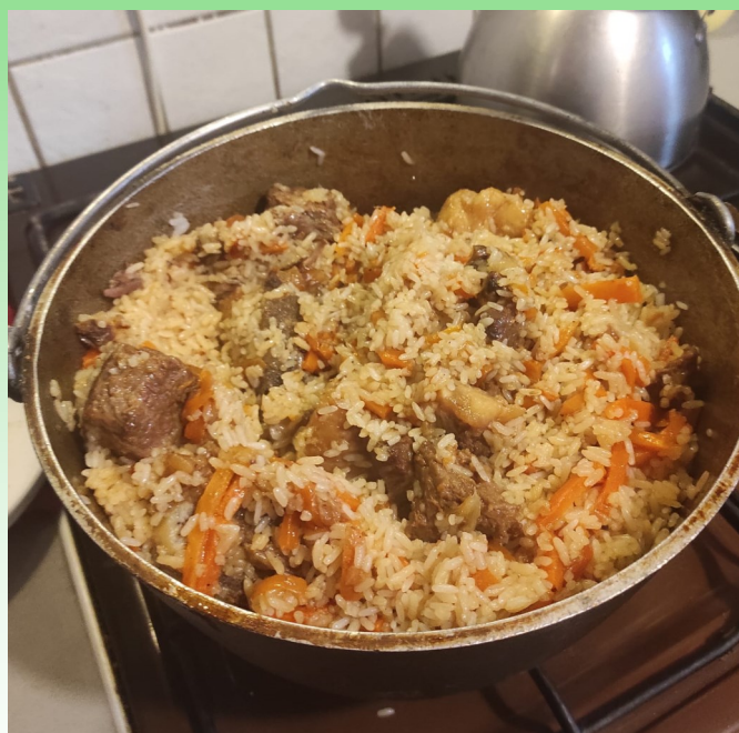
На фото—плов, приготовленный автором статьи

Главный секрет приготовления плова—относиться к процессу сокровенно и готовить его очень бережно.