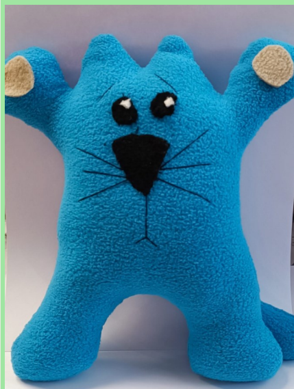
Зяц Виктория, 5 класс