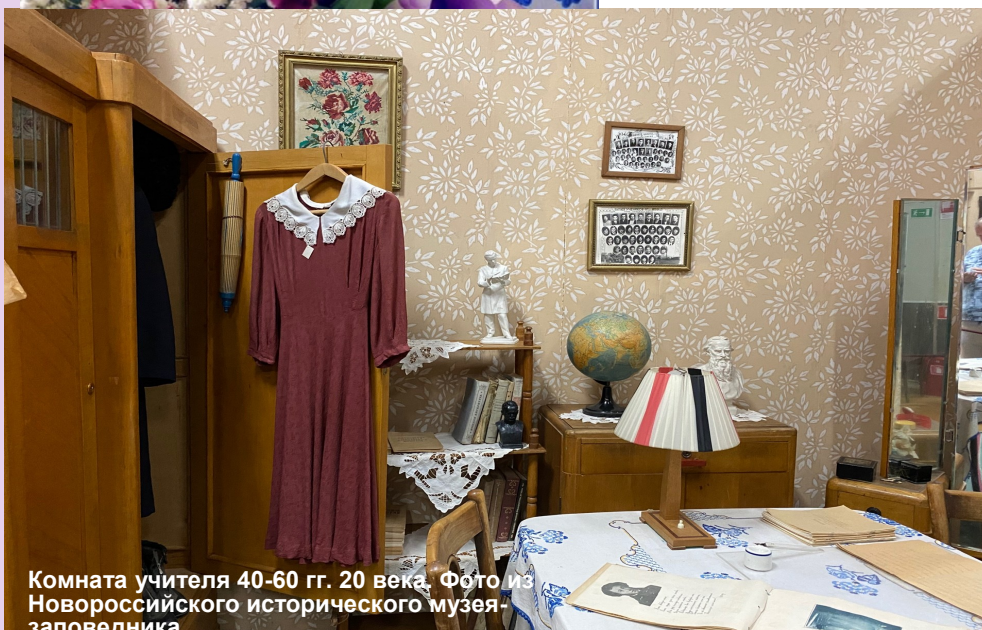
Комната учителя 40-60 гг. 20 века.