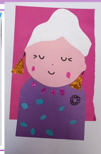
Черкасова Вика, 2 класс