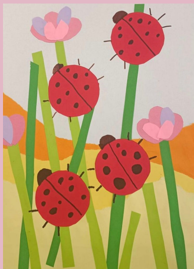
Мишаков Святослав, 5 класс